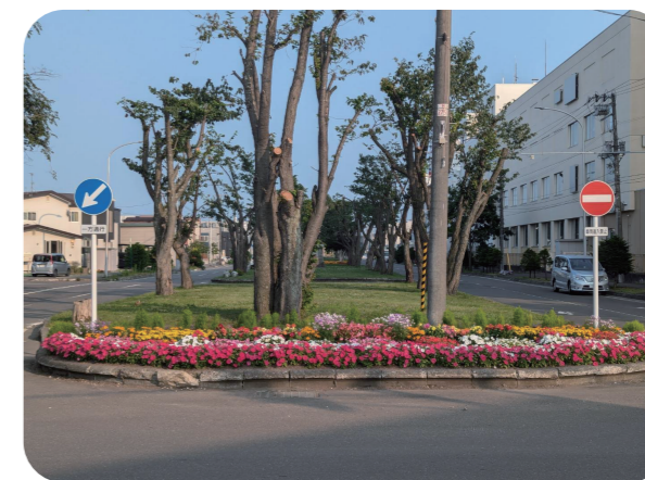
恵庭市役所庁舎の隣 グリーンベルトの花壇